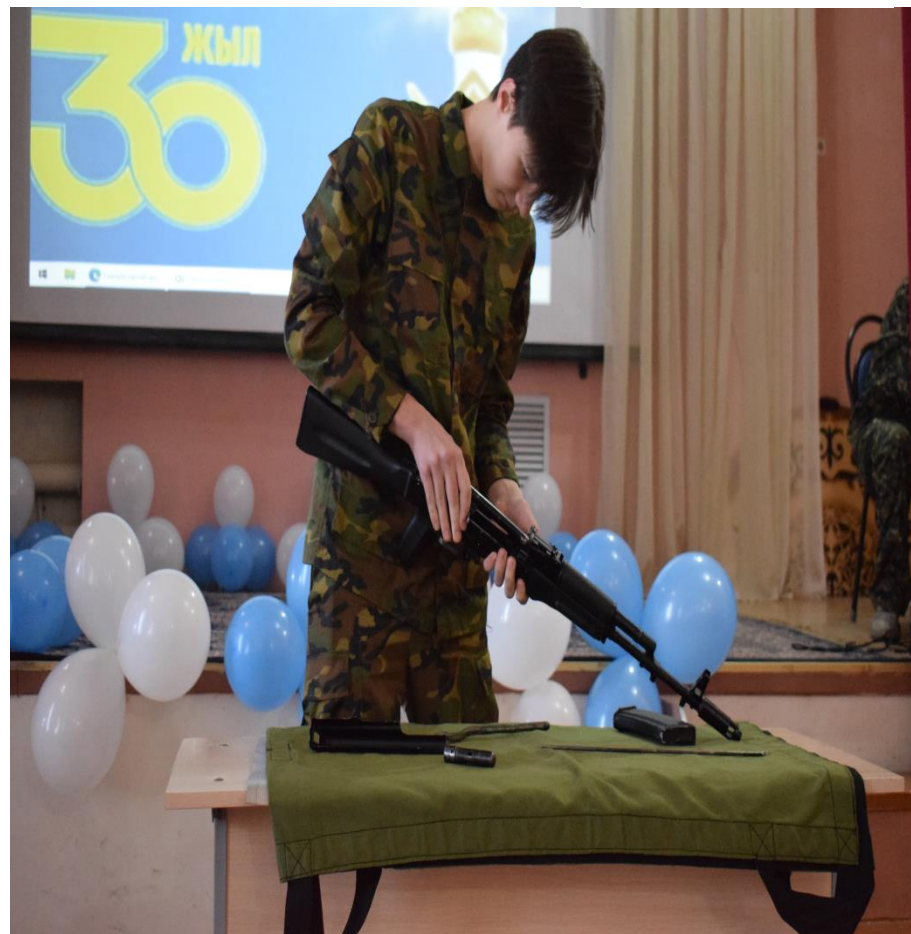
Автоматты шашып жинаудан жарыс