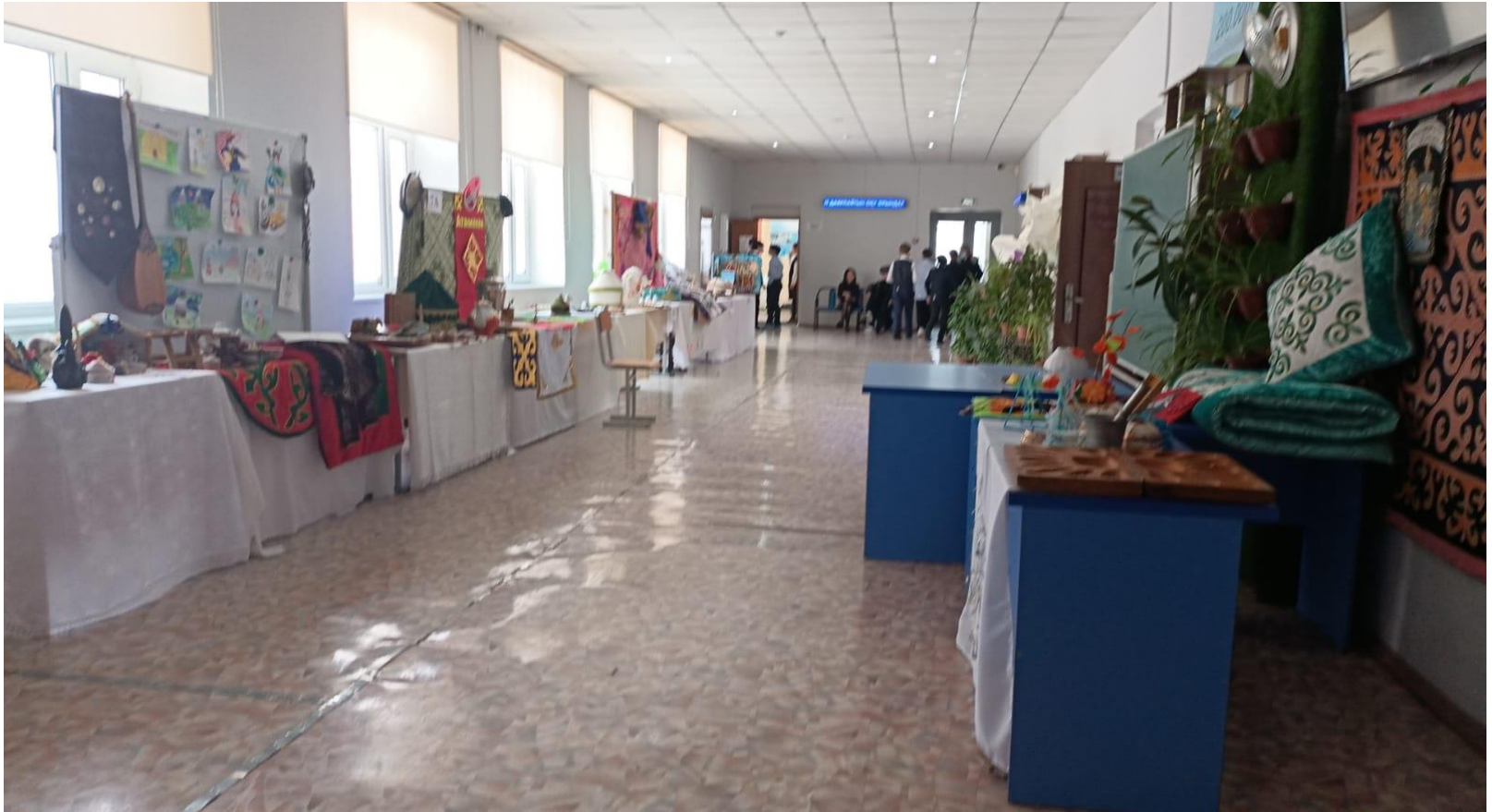
Наурыз мейрамына арналған көрме