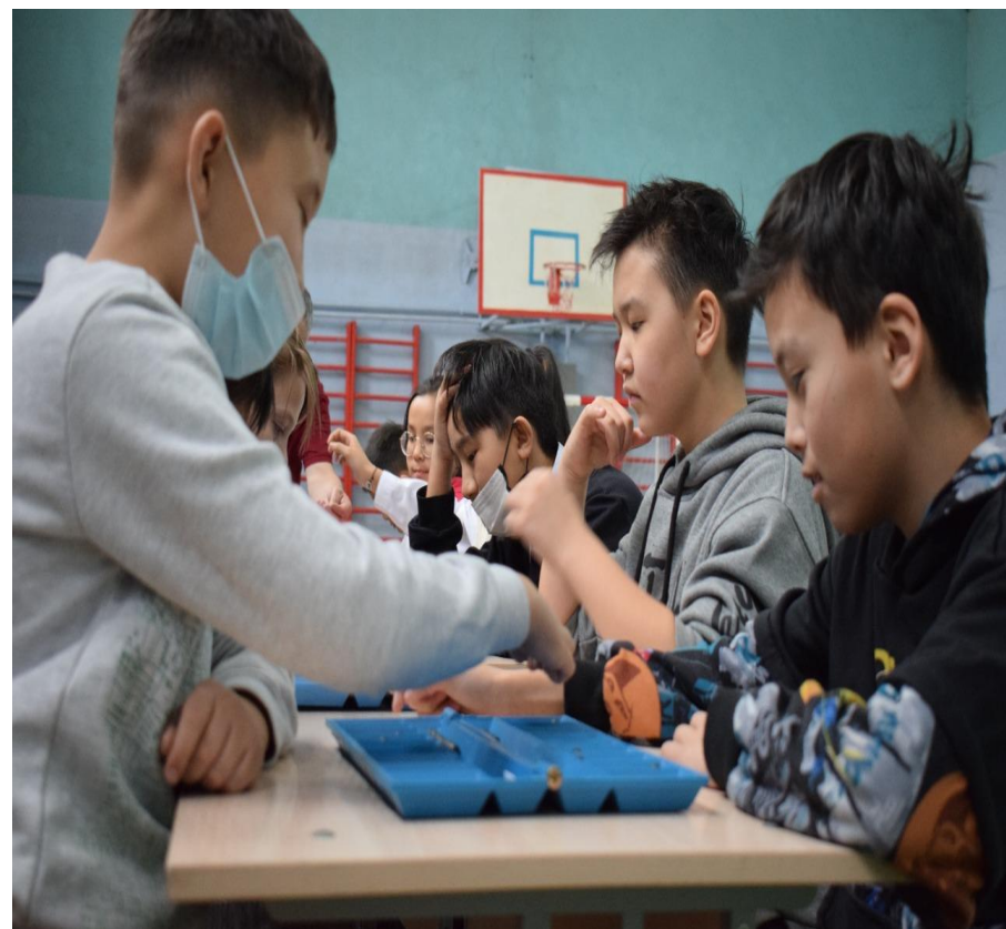
Тоғызқұмалақ ойынан жарыс