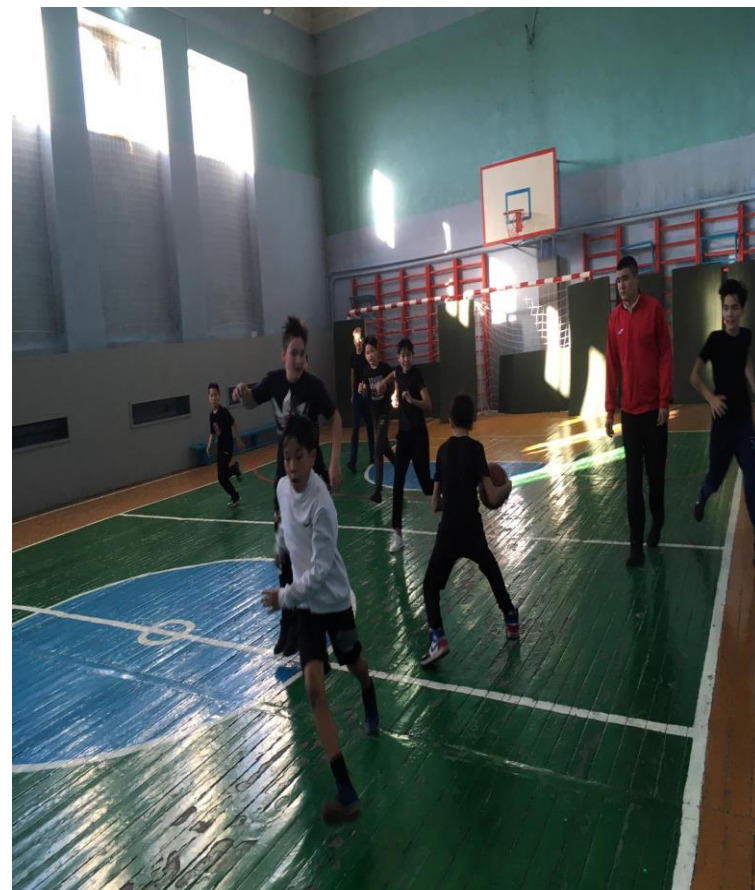
5-7 сыныптар арасында баскетболдан жарыс