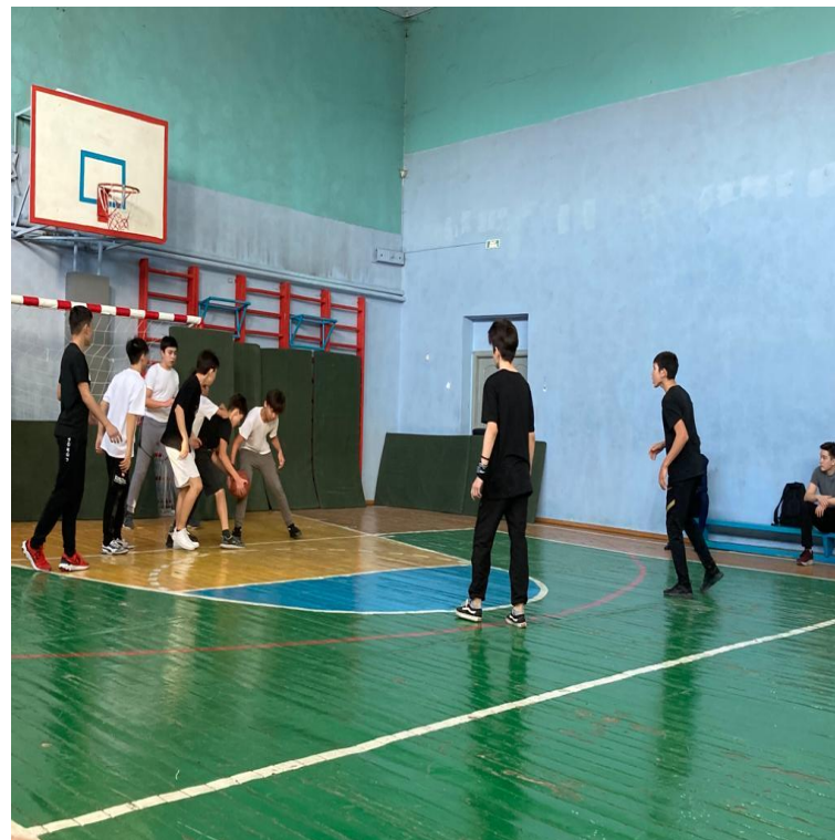
9-11 сыныптар арасында баскетболдан жарыс